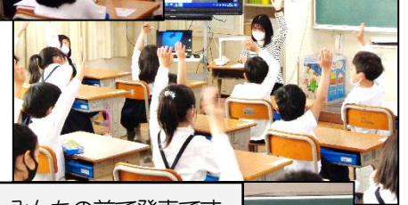
みんなの前で発表です