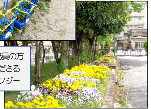
管理補助業務員の方 が育ててくださる かわいいバンジー