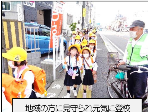
地域の方に見守られ元気に登校