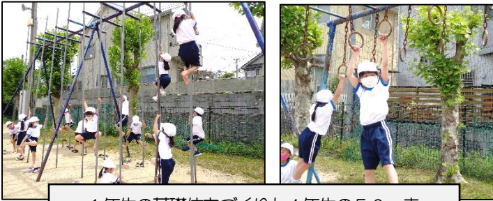
1年生の基礎体力づくりと4年生の50m走