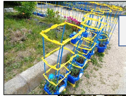
2年生の トマト栽培