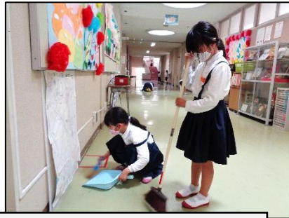
とことん頑張る玉川小の掃除の時間