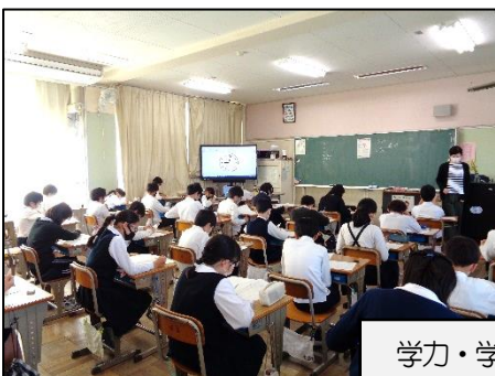
学力・学習状況調査を受ける6年生